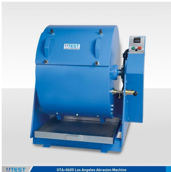
UTEST UTA-0600 Los Angeles Abrasion Machine

Машина оснащена автоматическим счетчиком оборотов, и при достижении заданного значения автоматически останавливается. Так же барабан оснащен блокирующим устройством, которое позволяет оператору зафиксировать барабан в нужном положении для удобства загрузки/выгрузки образца.